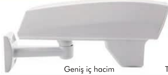
Geniş iç hacim