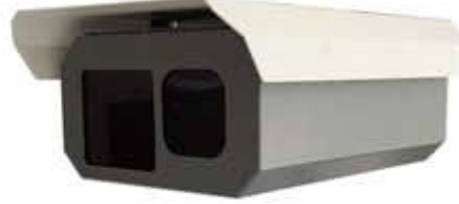
Geniş iç hacim