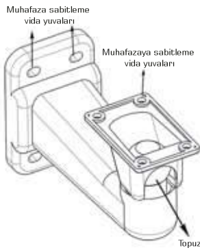
Muhafazaya sabitleme vida yuvaları