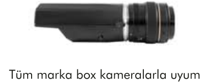
Muhafaza sabitleme vida yuvaları