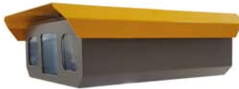
2 Kameralı Geniş İç Hacim