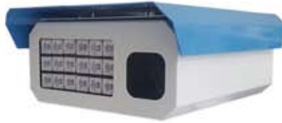
Geniş iç hacim